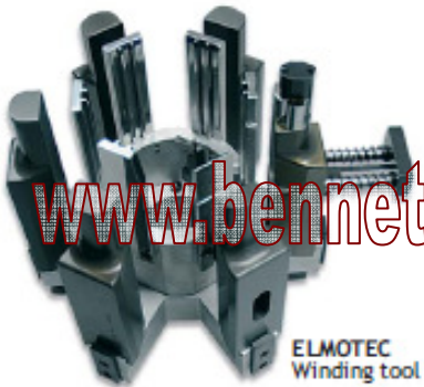
ELMOTEC Winding tool