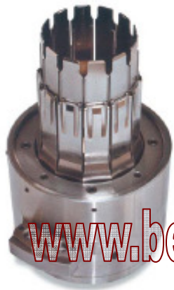
PAVESI Inserting tool