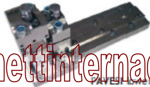
PAVESI Inserting tool