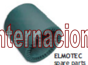
ELMOTEC spare parts