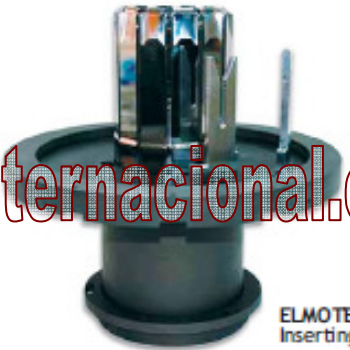
ELMOTEC Inserting tool