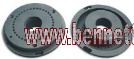
ELMOTEC spare parts