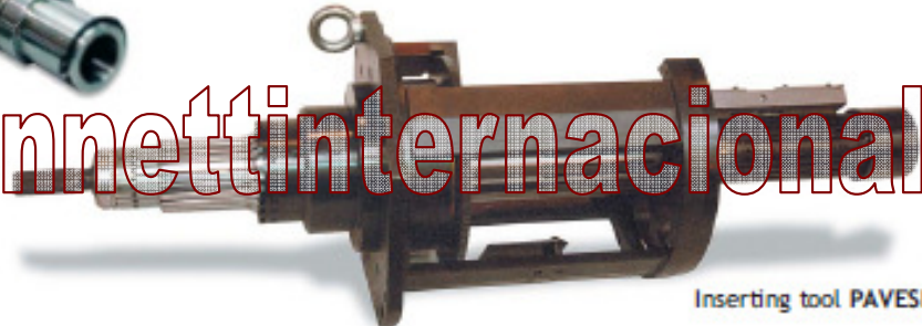
Inserting tool PAVESI IS1