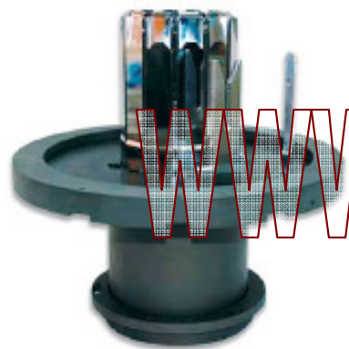
Inserting tool alternator ELMOTEC