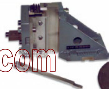
Insulating tool STATOMAT EU-130