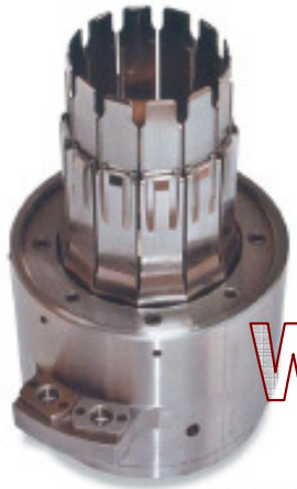
Inserting tool alternator PAVESI