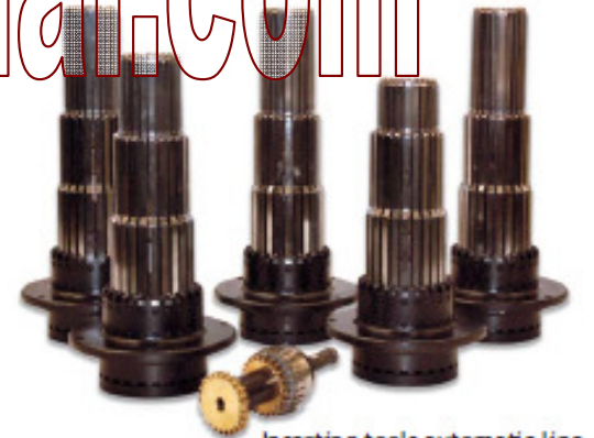
Inserting tools automatic line