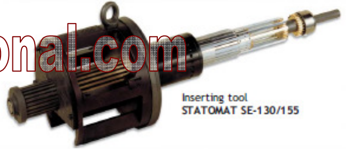
Inserting tool STATOMAT SE-130/155