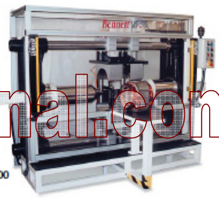
Prensa de conformar PCH-200 Forming press PCH-200