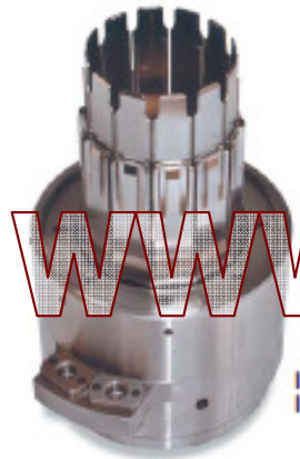
Insertador alternadores Inserting tool alternator