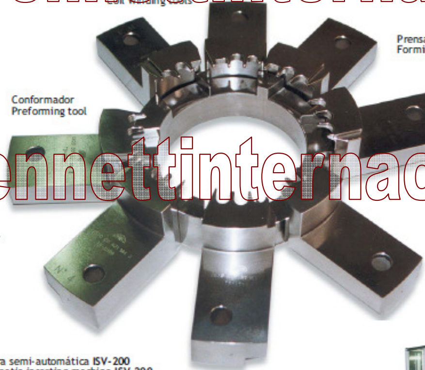
Conformador Preforming tool