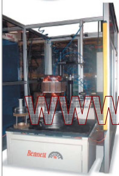
Insertadora semi-automática ISV-200 Semiautomatic inserting machine ISV-200