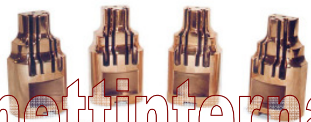
Formas de bobinar Coil winding tools