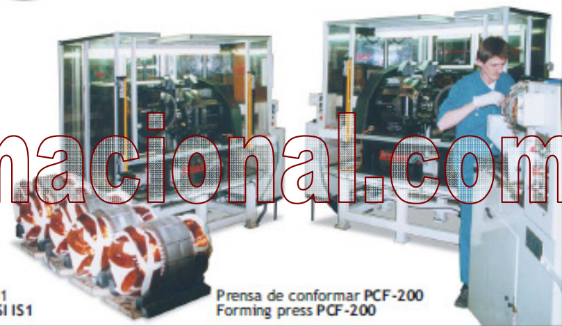
Prensa de conformar PCF-200 Forming press PCF-200