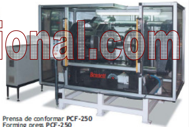
Prensa de conformar PCF-250 Forming press PCF-250